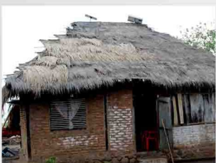
Solar Home System